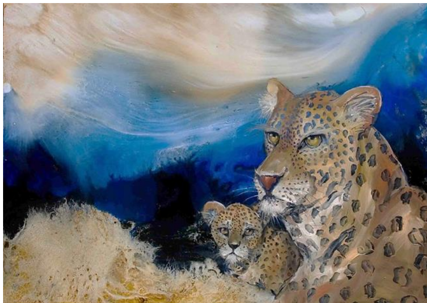
„LEOPARD MOTHER & SON“ - ARTIST BEAU VAN ZYL